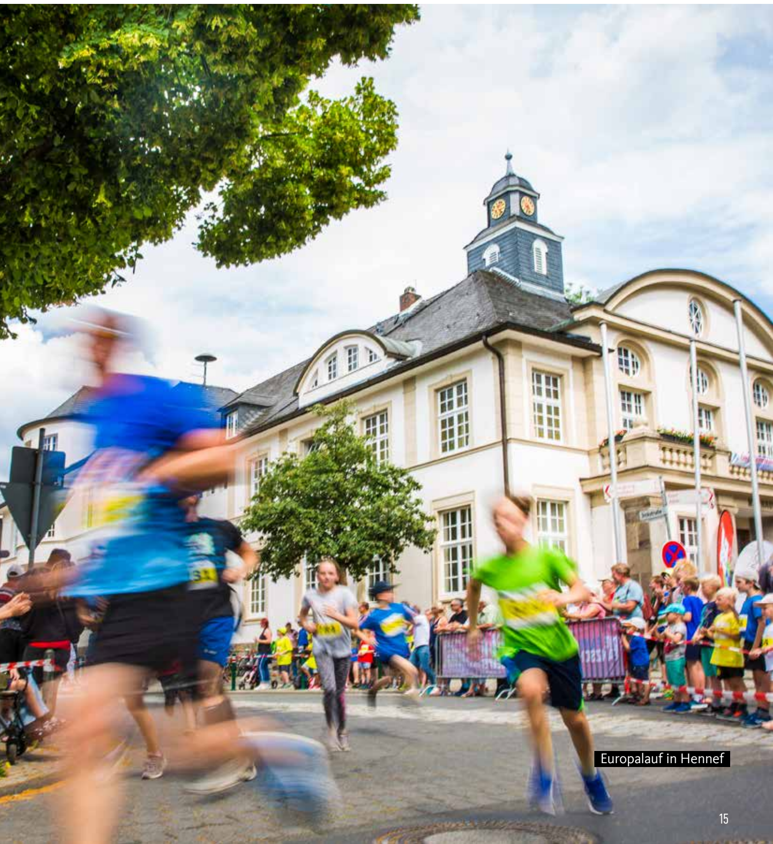
Europalauf in Hennef