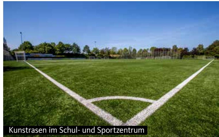
Kunstrasen im Schul- und Sportzentrum

Sie können spielen und den ganzen Tag viel Spaß haben.