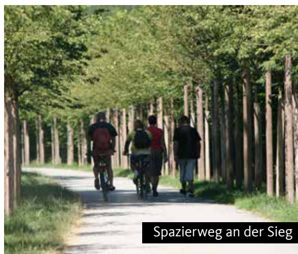
Spazierweg an der Sieg