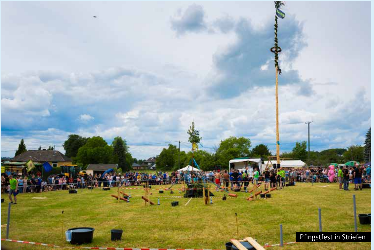
Pfingstfest in Striefen