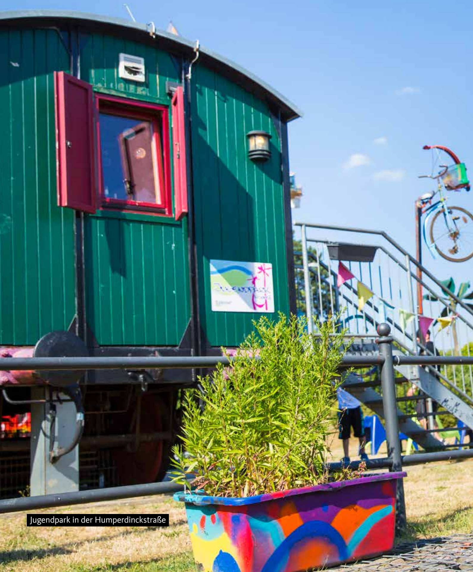
Jugendpark in der Humperdinckstraße