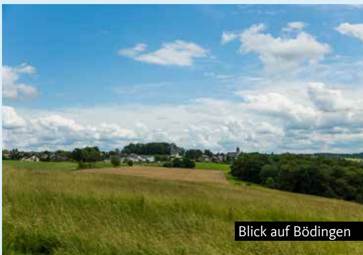
Blick auf Bödingen