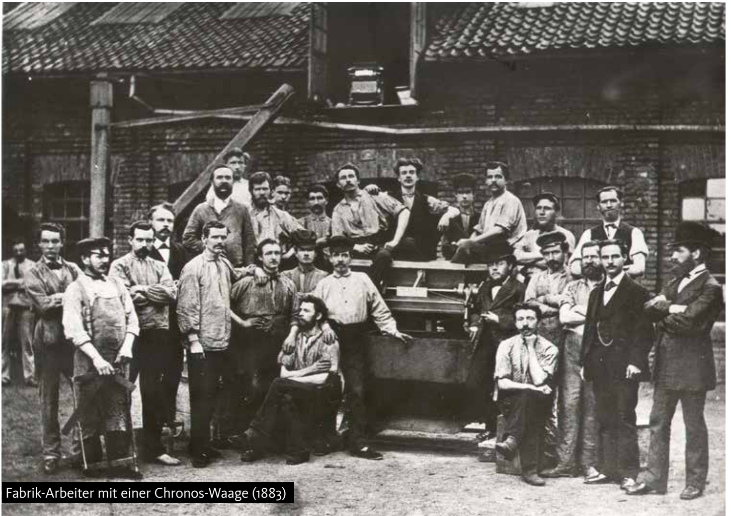
Fabrik-Arbeiter mit einer Chronos-Waage (1883)