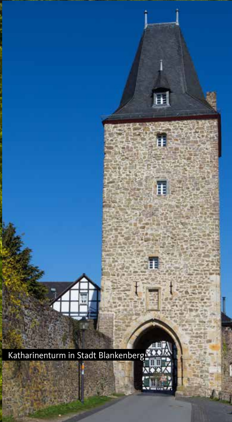
Katharinenturm in Stadt Blankenberg