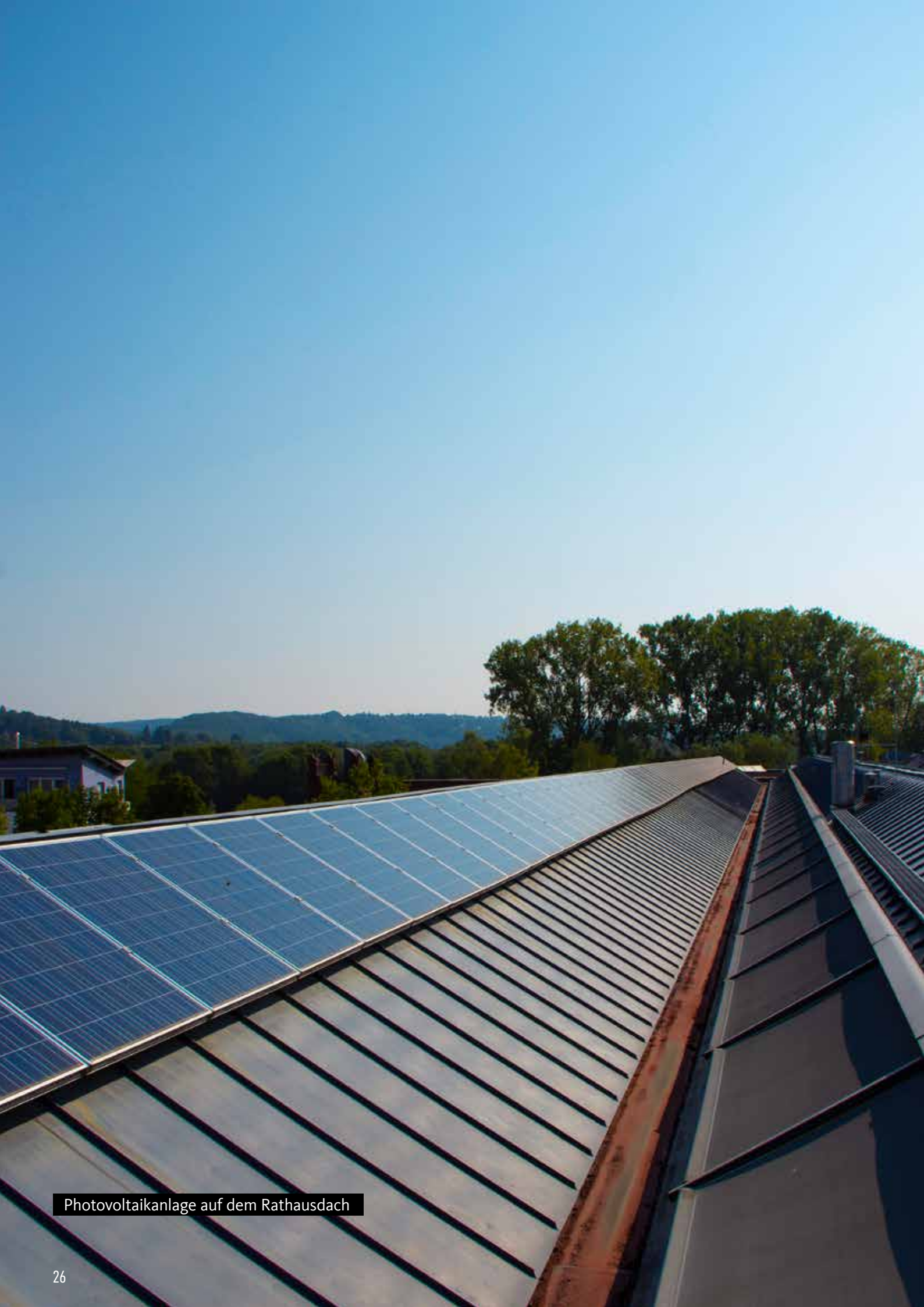
Photovoltaikanlage auf dem Rathausdach