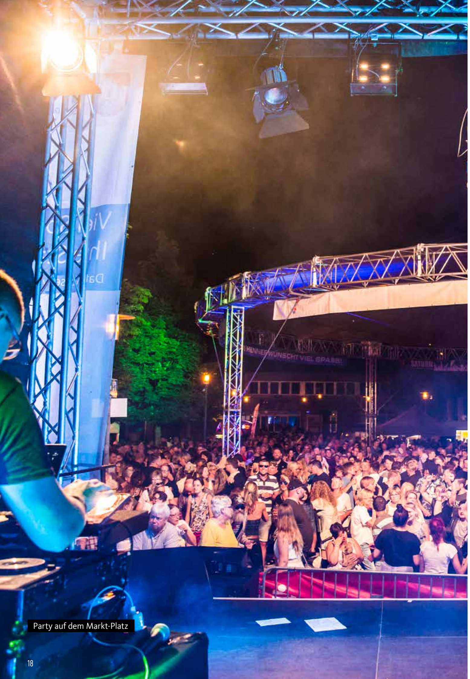
Party auf dem Markt-Platz