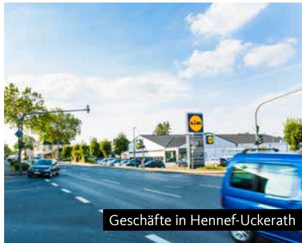
Geschäfte in Hennef-Uckerath