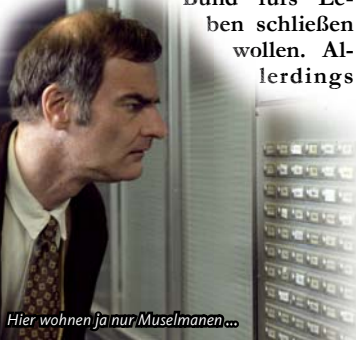
Hier wohnen ja nur Muselmanen...

34. Hennefer FILMFESTSPIELchen, 6.11., 20 Uhr., Kur-Theater-Hennef, Königstr. 19a. Eintritt: 6 Euro. Der Regisseur wird zur Vorstellung anwesend sein. Außerdem gibt es einen Überraschungsvorfilm. Vorverkauf: Kulturamt der Stadt Hennef, Rathaus, Frankfurter Straße 97, Zimmer E.46.