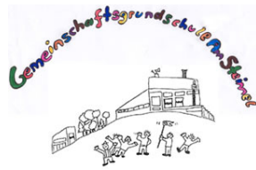
GGS Am Steimel