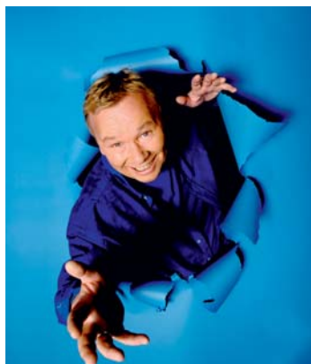
„Lappen weg – Frauen ohne Regeln“ (Bild u.): am 5.9. in Hennef. Außerdem: Guido Cantz (ganz oben) am 12.5., Bernd Stelter (oben) am 19.11. und die a-capella-Sänger der Wise Guys (oben links) am 18.6.