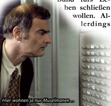
Hier wohnen ja nur Muselmanen...

dann noch der KFZ-Mechaniker Emrah: Seine Auserwählte ist ein deutscher Mann! Wie er das seiner Familie beibringen soll, weiß er noch nicht. Zumal diese gerade ein Hochzeitarrangement mit einem türkischen Mädchen verhandelt. „Evet, ich will!“ – das sind 4 Paare, 4 Probleme und 2 Hochzeiten. Turbulent, absolut komisch und schön politisch inkorrekt! 34. Hennefer FILMFESTSPIELchen, 6.11., 20 Uhr., Kur-Theater-Hennef, Königstr. 19a. Eintritt: 6 Euro. Der Regisseur wird zur Vorstellung anwesend sein. Außerdem gibt es einen Überraschungsvorfilm. Vorverkauf: Kulturamt der Stadt Hennef, Rathaus, Frankfurter Straße 97, Zimmer E.46.