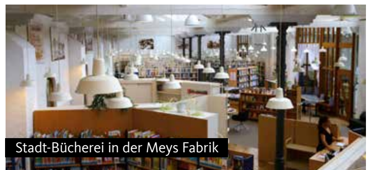
Stadt-Bücherei in der Meys Fabrik