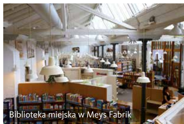
Biblioteka miejska w Meys Fabrik

miłośników sztuki z całego regionu do Meys Fabrik dwiema corocznymi wystawami.