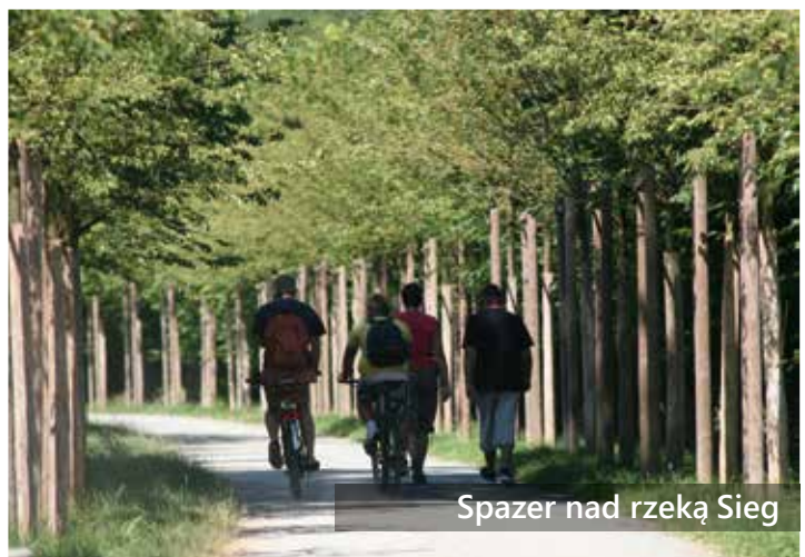
Spazier nad rzeką Sieg