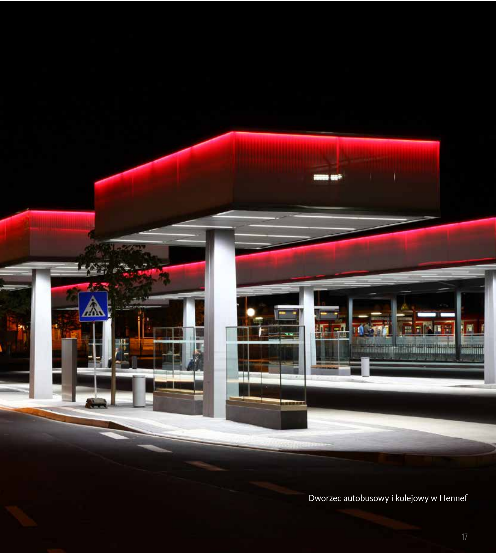
Dworzec autobusowy i kolejowy w Hennef