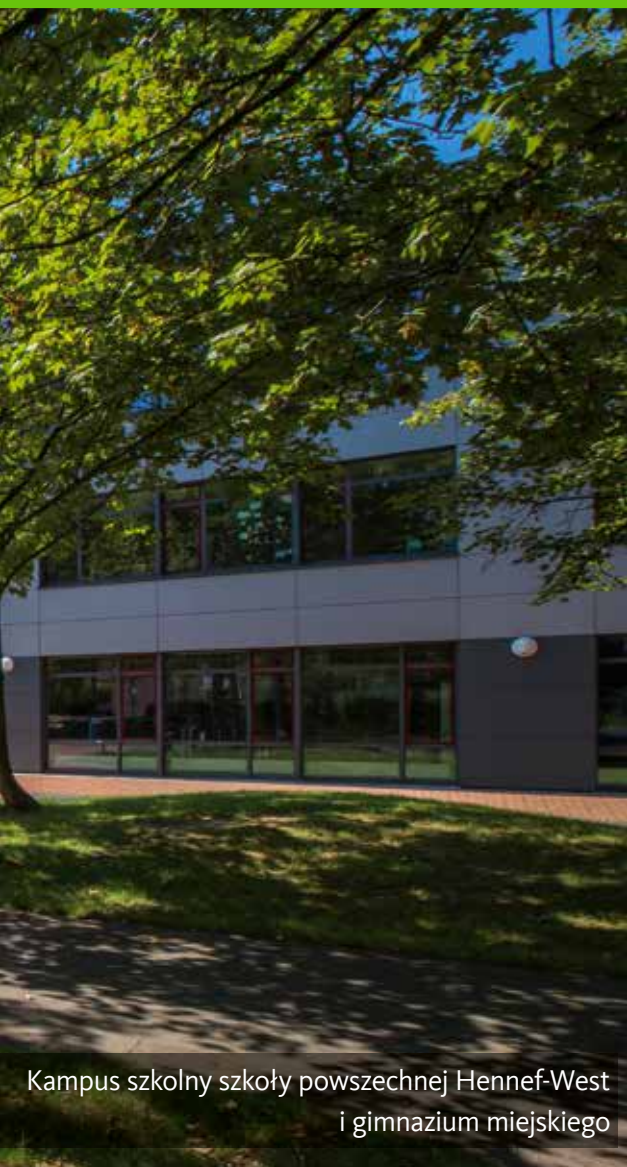
Kampus szkolny szkoły powszechnej Hennef-West i gimnazjum miejskiego

Osiem szkół podstawowych - siedem z otwartymi szkołami całodziennymi - zapewnia miastu kompleksową obsługę. Ponadto istnieją dwie miejskie szkoły ogólnokształcące, jedna prywatna szkoła ogólnokształcąca zajmująca się sztuką i jedno gimnazjum miejskie.