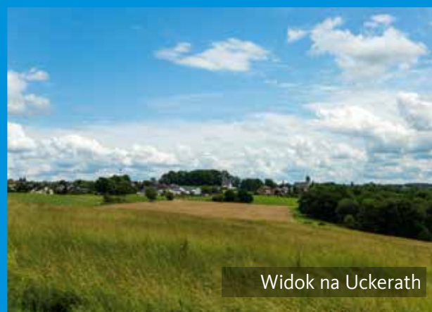
Widok na Uckerath