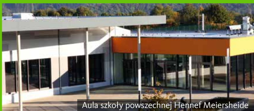
Aula szkoły powszechnej Hennef Meiersheide