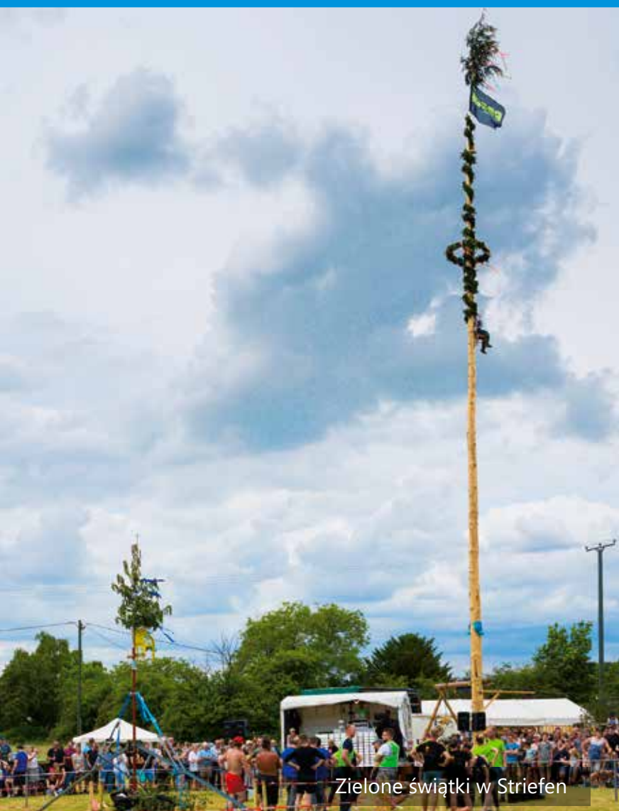
Zielone świętki w Striefen