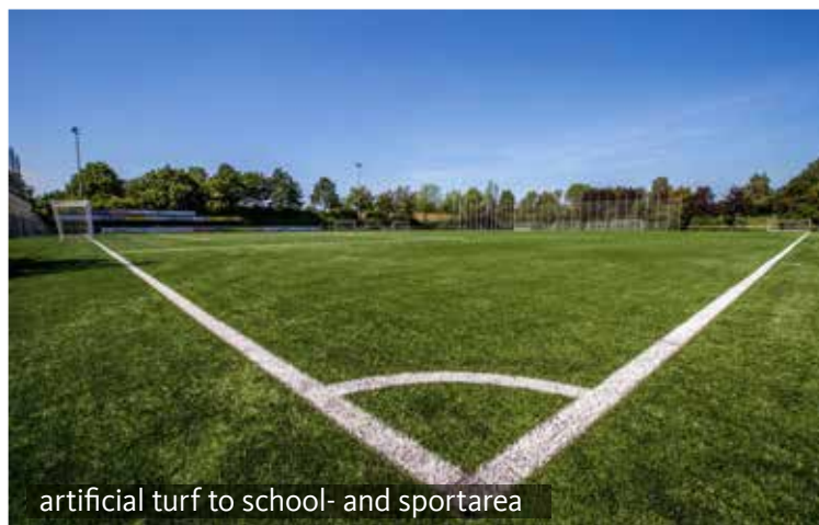
artificial turf to school- and sportarea

Miasto realizuje wszystkie projekty sportowe w ścisłej współpracy ze związkiem StadtSportVerband, który dzięki „Układowi na rzecz sportu” (niem. Pakt für den Sport) zawartemu w 2005 roku ma znaczący wpływ na planowanie obiektów sportowych w mieście. W skrócie: Używane od kilku lat wyrażenie „Hennef — miasto sportu” to coś więcej niż tylko slogan. Widać to również na corocznej ceremonii uczczenia odnoszących sukcesy sportowców — w niektórych latach jest ich ponad 450 — oraz podczas święta KinderSportFest, które od 2005 roku odbywa się w każdą pierwszą sobotę po wakacjach letnich na rynku w Hennef. Ponad 3000 dzieci od rana do wieczora testuje tam oferty klubów sportowych Hennef — od woltyżerki do tenisa.