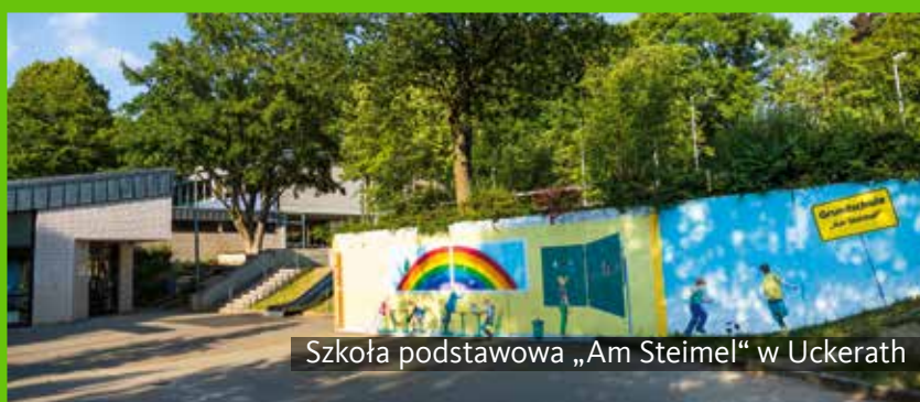
Szkoła podstawowa „Am Steimel“ w Uckerath

nef klubu piłkarskiego Mittelrhein e.V. czyta się niczym leksykon osobistości światowego futbolu. Po obszernej rozbudowie w ostatnich latach szkoła sportowa Hennef jest nadal uważana za jedną z wiodących szkół sportowych w Europie i jest ojczyzną bokserów, zapaśników, judoków i ciężarowców, którzy dzięki „Centrum szkoleniowym sztuk walki” i państwowym ośrodkom sportowym znaleźli tu swój dom.