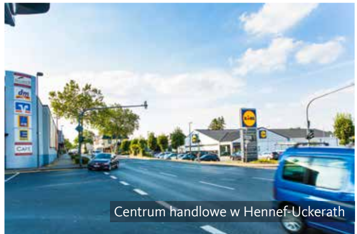
Centrum handlowe w Hennef-Uckerath