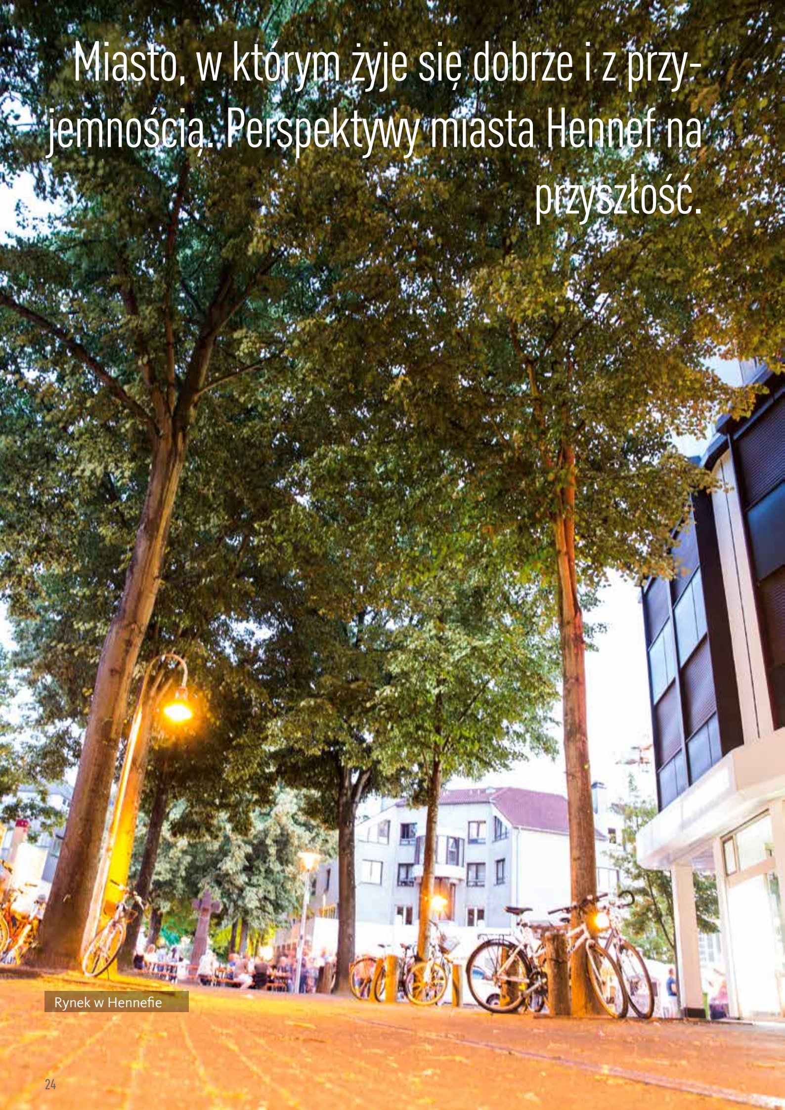
Rynek w Hennefie

Miasto, w którym żyje się dobrze i z przyjemnością. Perspektywy miasta Hennef na przyszłość.