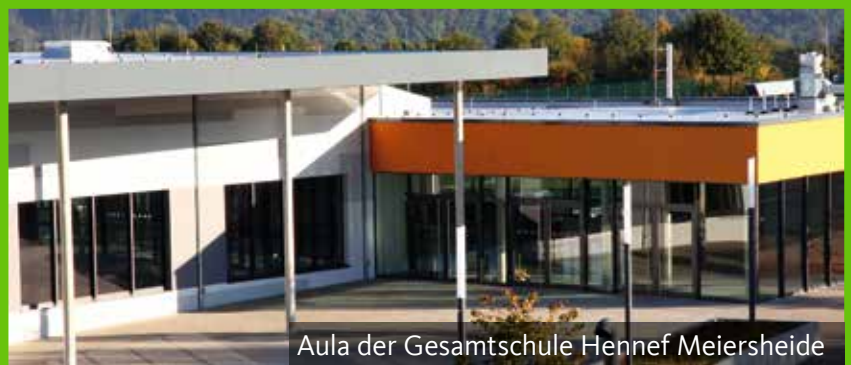
Aula der Gesamtschule Hennef Meiersheide