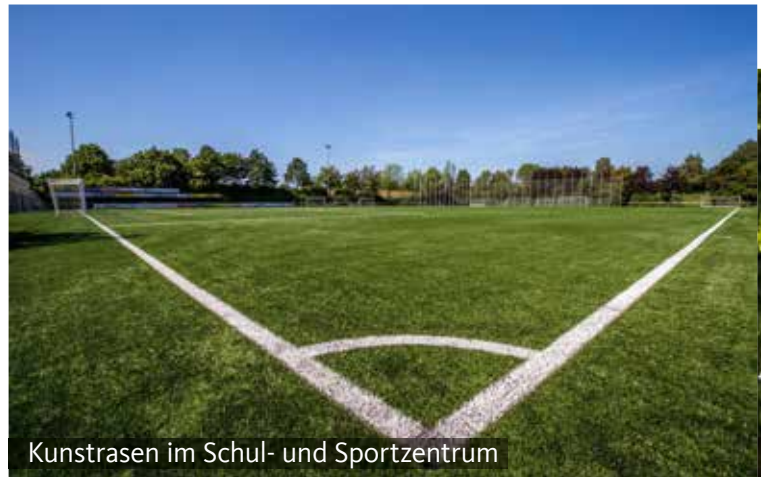
Kunstrasen im Schul- und Sportzentrum

Nicht zu vergessen der Europalauf mit Strecken bis zum Halbmarathon, der jedes Jahr im Juni stattfindet. 2.000 Läuferinnen und Läufer gehen dabei an den Start.