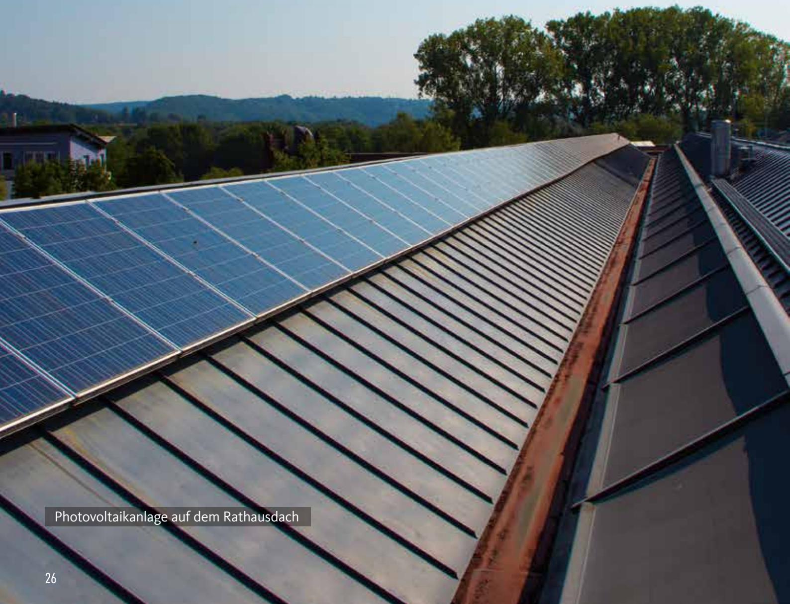
Photovoltaikanlage auf dem Rathausdach