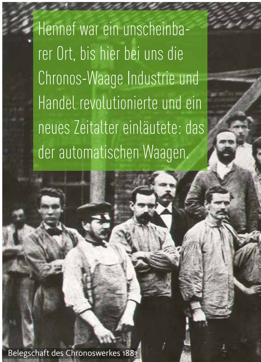
Belegschaft des Chronoswerkes 1883

Hennef war ein unscheinbarer Ort, bis hier bei uns die Chronos-Waage Industrie und Handel revolutionierte und ein neues Zeitalter einläutete: das der automatischen Waagen.