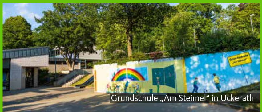
Grundschule „Am Steimel“ in Uckerath

das „Who is Who“ des Weltfußballs. Nach umfassenden Erweiterungen in den letzten Jahren gilt die Sportschule Hennef nach wie vor als eine der europaweit führenden Sportschulen und ist überdies Heimat für Boxer, Ringer, Judoka und Gewichtheber, die hier mit ihrem „Trainingszentrum für Kampfsport“ und Landesleistungszentren beheimatet sind.