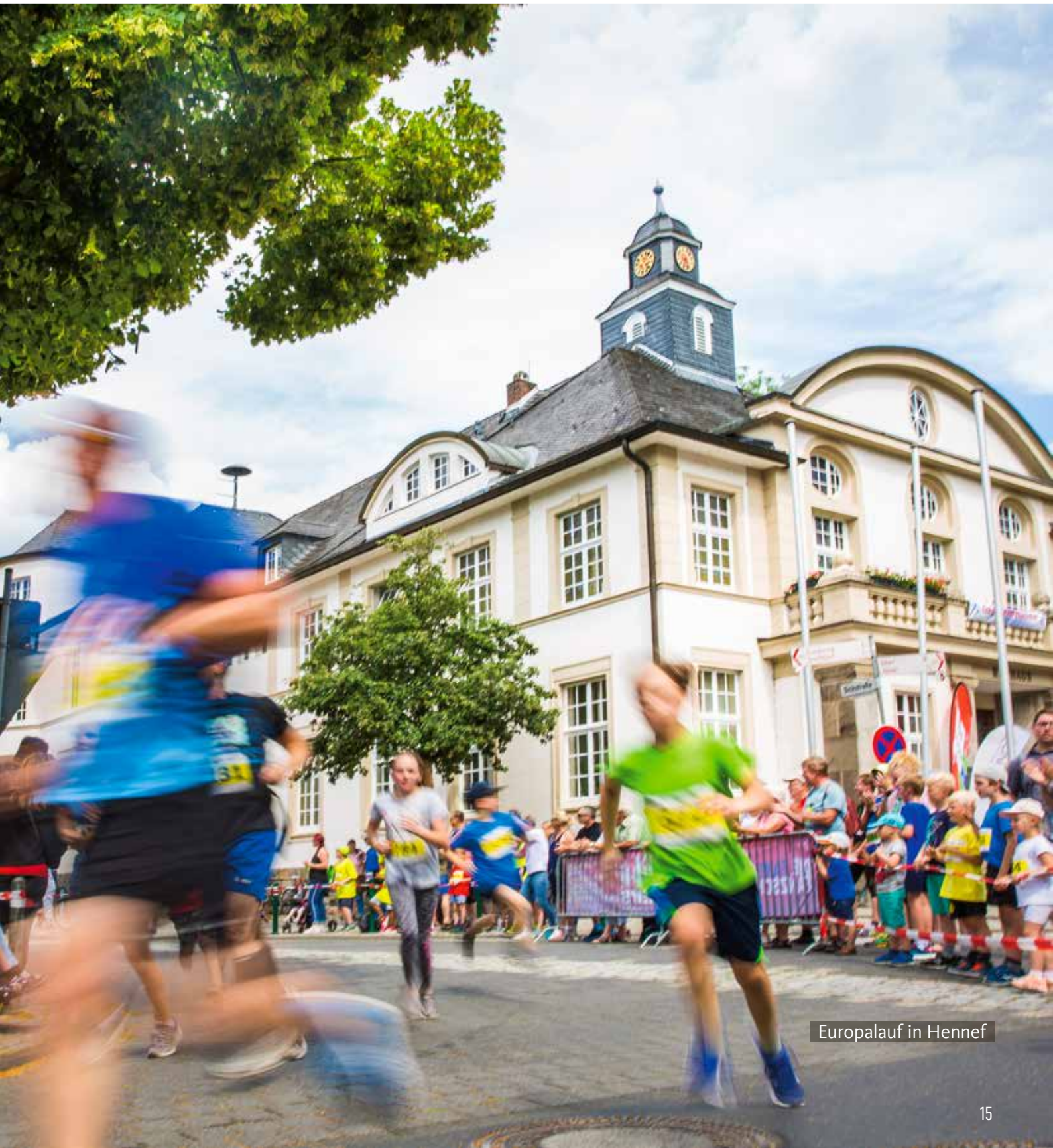
Europalauf in Hennef