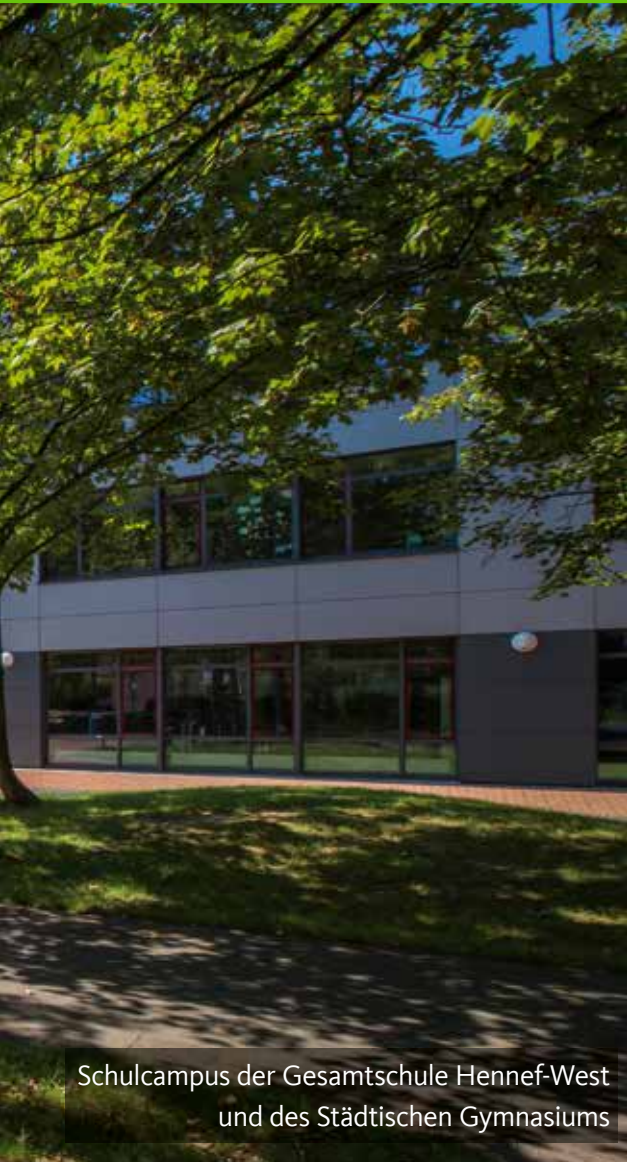
Schulcampus der Gesamtschule Hennef-West und des Städtischen Gymnasiums

Acht Grundschulen – sieben mit offener Ganztagschule – versorgen die Stadt flächendeckend. Hinzu kommen zwei städtische Gesamtschulen, eine private Gesamtschule mit dem Schwerpunkt Kunst und ein städtisches Gymnasium.