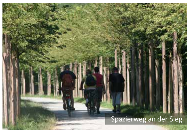
Spazierweg an der Sieg