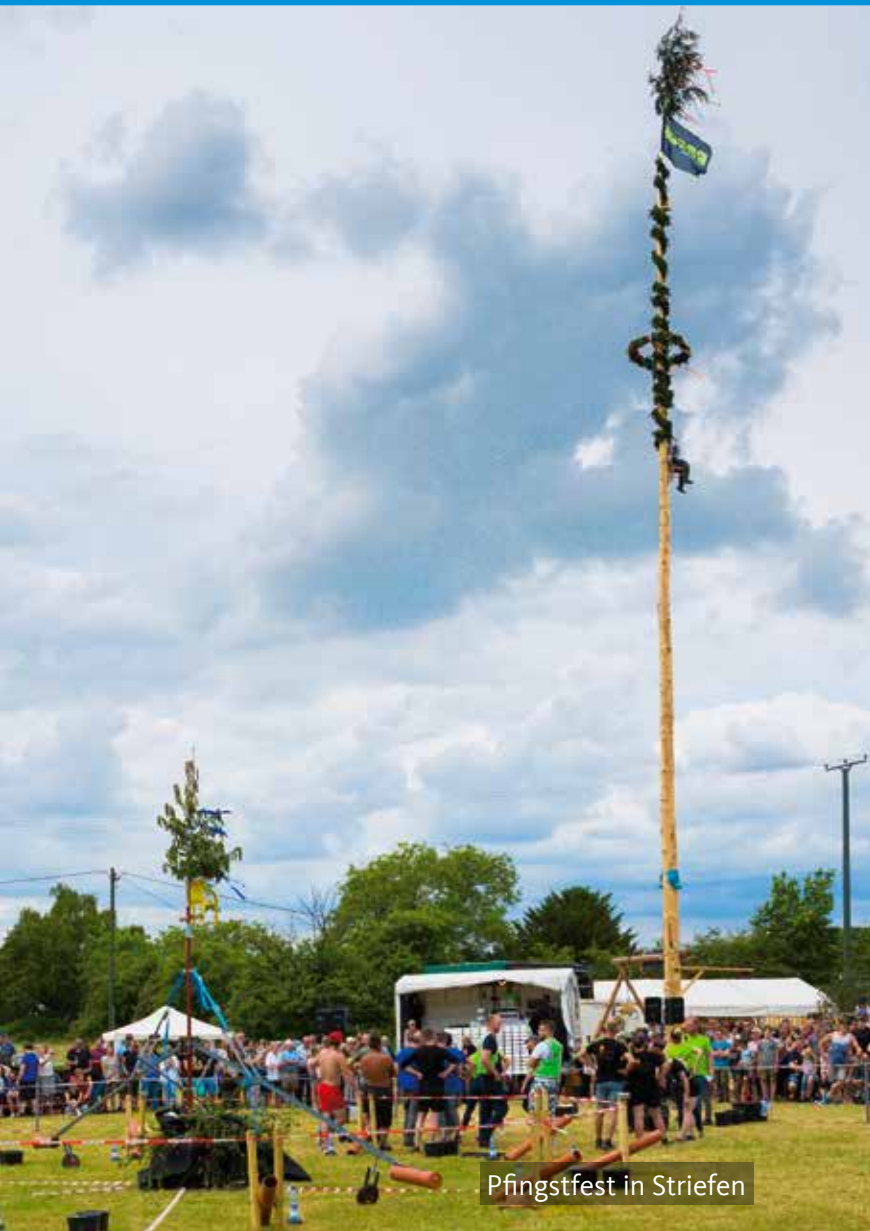
Pfingstfest in Striefen

Eine einmalige Mischung aus städtischem Flair und ländlichem Charme.