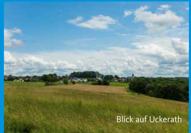
Blick auf Uckerath