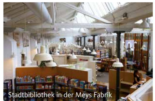
Stadtbibliothek in der Meys Fabrik

Die Stadtbibliothek Hennef – mit 60.000 Besuchen pro Jahr die meistbesuchte Kultureinrichtung der Stadt – ist eine Bildungseinrichtung für alle Bürgerinnen und Bürger, ermöglicht den Zugang zu allen Medienformen, bietet Informationen für Beruf, Schule und Freizeit. Sie kann heute auf eine 60-jährige Tradition zurückblicken. Mehr als 34.000 Medieneinheiten stehen den Benutzern zur Verfügung. Neben Büchern gibt es über 50 Zeitungs- und Zeitschriftenabos, Hörbücher, Hörspiel-CDs für Kinder, CDs, CD-ROMs, DVDs, Spiele und natürlich auch Blu-rays und Konsolenspiele. Hinzu kommen mehrere Arbeitsplätze, an denen Schüler und Studierende in Ruhe recherchieren oder Hausarbeiten schreiben können. Das Lesecafé lädt zum verweilen ein.