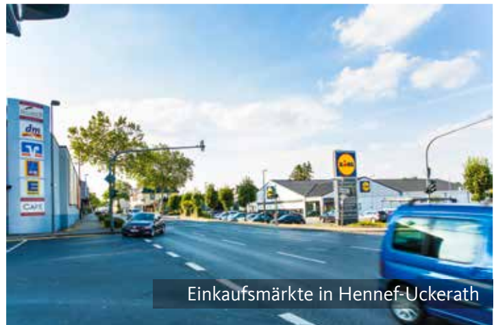
Einkaufsmärkte in Hennef-Uckerath