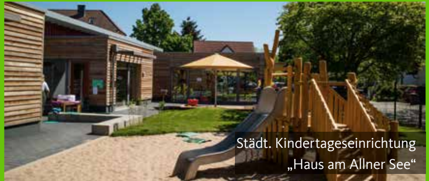
Städt. Kindertageseinrichtung „Haus am Allner See“