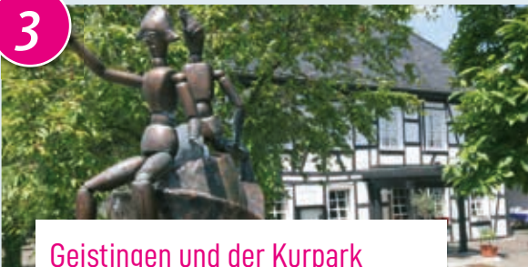
Geistingen und der Kurpark

Geistingen ist der Teil Hennefs, der urkundlich als erster erwähnt wurde: im Jahre 799. Der Carnevalsbrunnen auf dem Geistinger Platz (Foto) und die romanische Pfarrkirche St. Michael sind einen Besuch wert, das ehemalige Redemptoristenkloster kann man aber leider nur von außen sehen. Das wichtigste Naherholungsgebiet im Ort ist zweifellos der Kurpark. Minigolfplatz, Bewegungslandschaft, Spielplatz, Labyrinth, geologischen Lehrpfad und Wildgehege laden zum Verweilen ein. Hier trifft man sich!