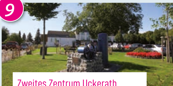
Zweites Zentrum Uckerath