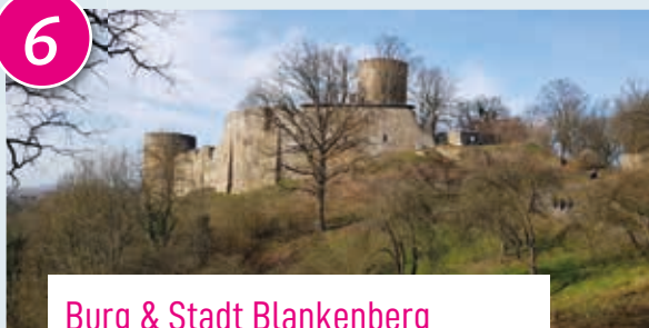
Burg & Stadt Blankenberg

Das touristische Hauptziel in Hennef! Die Burgruine lässt die einstige Macht des Ortes erkennen. Erstmals 1181 erwähnt und im 30-jährigen Krieg zerstört, bieten die Burgtürme heute eine prächtige Aussicht ins Siegtal. Stadt Blankenberg entführt mit malerischen Fachwerkhäusern ins Mittelalter. Gastronomie, Turmmuseum mit Weinbauabteilung und zahlreiche Stadtführungen bieten für jeden das Richtige. Zum Beispiel „Nachtwächterführungen“ und andere Kostümführungen. Rund um Stadt Blankenberg lockt ein Weinwanderweg ins Naturschutzgebiet. Sehenswert außerdem: Stadtmauer und Stadttore.