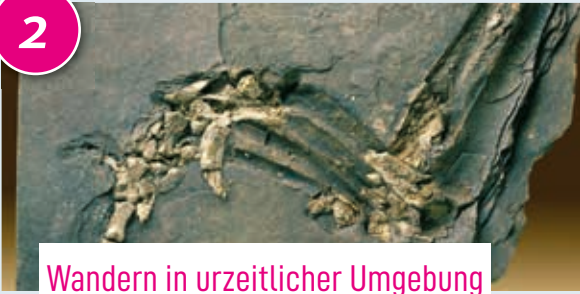
Wandern in urzeitlicher Umgebung

Mit dem Bergbau ist es in Hennef vorbei, auch die Fossilienlagerstätte ist erschlossen, aber zwischen Geistingen und Rott lohnt sich ein Spaziergang vorbei an überwucherten Abraumhalden und durch einen malerischen Wald. Vor 25 Millionen Jahren im „Oligozän“ war hier ein See. Ablagerungen wurden bis weit ins 19. Jahrhundert abgebaut. Neben dem Ölschiefer fand man tausende Fossilien: Die Rotter Fossilienlagerstätte gilt als eine der bedeutendsten weltweit. Fundstücke kann man im Bonner Goldfuß-Museum sehen, und in der kleinen, feinen Ausstellung „Krokodile unter Palmen – der Bergbau in Hennef-Rott“ im Rathaus.