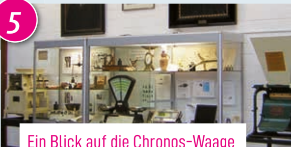
Ein Blick auf die Chronos-Waage

Neben dem Waagen-Wanderweg würdigt die Stadt die Erfindung der Hennefer Chronos-Waage mit einer kleinen Dauerausstellung „Gewichte, Waagen und Wägen im Wandel der Zeit“ in der Hennefer Meys Fabrik (Beethovenstraße 21). Die Vitrinen geben einen Einblick in die Geschichte des Wiegens von den Anfängen in der Frühzeit bis zu modernen Supermarktwagen. Zu sehen während der Öffnungszeiten der Stadtbibliothek in der Meys Fabrik. Einen Infolyer zum Waagen-Wanderweg bekommt man in der Tourist-Info.