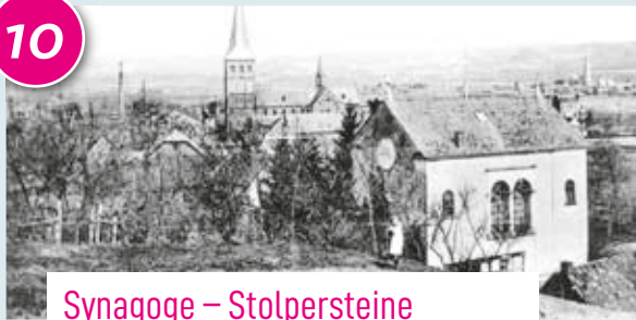
Synagoge – Stolpersteine

Einst war der Hennefer Ortsteil Geistingen Sitz einer jüdischen Gemeinde mit Synagoge und Friedhof. Am 10. November 1938 wurde die Synagoge zerstört, zuvor bereits hatte man die Hennefer Juden drangsaliert und brutal ins Abseits gedrängt, später sind fast alle ermordet worden. Die Grundmauern der Synagoge sind heute Gedenkstätte, ebenso der jüdische Friedhof. Im Rathaus befindet sich ebenfalls eine Gedenkstätte. Zu sehen sind unter anderem Modelle der Synagoge und des Thoraschreins sowie Fotos des Inneren der Synagoge.