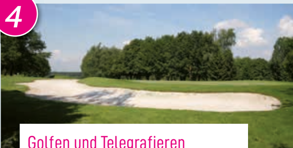
Golfen und Telegrafieren

Haus Dürresbach – malerische Hofanlage, Restaurant, Pferdehof und nebenan der Golfclub Rhein-Sieg e.V. mit 18- und 4- Lochplatz, Drivingrange, Übungsgrüns und -bunkern und das ganze Jahr bespielbar. In Söven lohnt sich außerdem ein Spaziergang rund um den historischen optischen Telegrafenturm aus dem 19. Jahrhundert, den einzigen der Linie Berlin-Koblenz, der in seinem Baubestand noch erhalten ist. Ein ganz besonderes Beispiel der Telekommunikationsgeschichte. Von hier aus bietet sich eine traumhafte Aussicht auf Hennef.