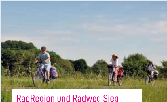
RadRegion und Radweg Sieg

Der Natursteig Sieg ist ein Qualitätswanderweg mit rund 200 Kilometern Länge von Siegburg bis Mudersbach. Drei Etappen des Natursteigs und mehrere Erlebniswege führen ganz oder teilweise durch Hennef. Natürlich klar und deutlich ausgeschildert. Wie der ganze Natursteig zeichnen sich auch die Hennefer Etappen durch eine gelungene Mischung aus anspruchsvoller Streckenführung und kulturellen Sehenswürdigkeiten aus. Der Steig führt häufig über kleine Pfade und Höhenzüge, bietet Natur pur und traumhafte Ausblicke ins Siegtal. Dabei geht es vorbei an historischen Kulturlandschaften und Denkmälern, so an Schloss Allner, der Wallfahrtskirche „Zur schmerzhaften Mutter“ in Bödingen und Burg und Stadt Blankenberg. Ausführliche Informationen zum Natursteig bekommt man auf www.naturregion-sieg.de und in der Tourist-Info Hennef.