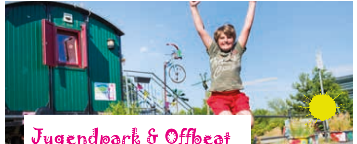
Jugendpark & Offbeat

Die neue 18-Loch Minigolfanlage im Hennefer Kurpark ist ein Spaß für die ganze Familie. Direkt nebenan gibt es ein Großschachfeld. Geöffnet freitags 14 Uhr bis 18 Uhr, samstags und sonntags 11 Uhr bis 18 Uhr. Infos: https://www.minigolf-hennef.de .